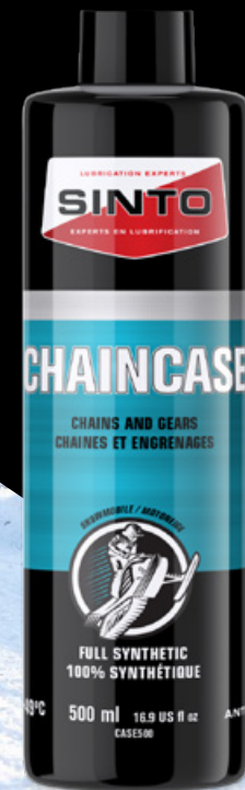
CHAÎNES ET ENGRENAGES