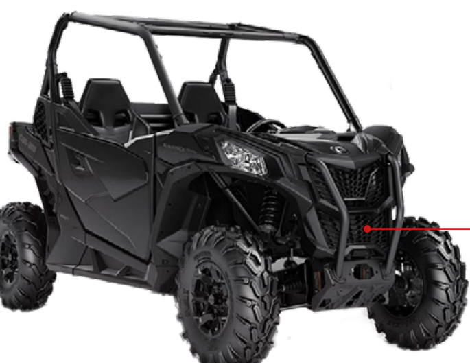
TRANSMISSION ET DIFFÉRENTIELS