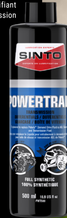
TRANSMISSION, DIFFÉRENTIELS ET BOÎTE DE VITESSES