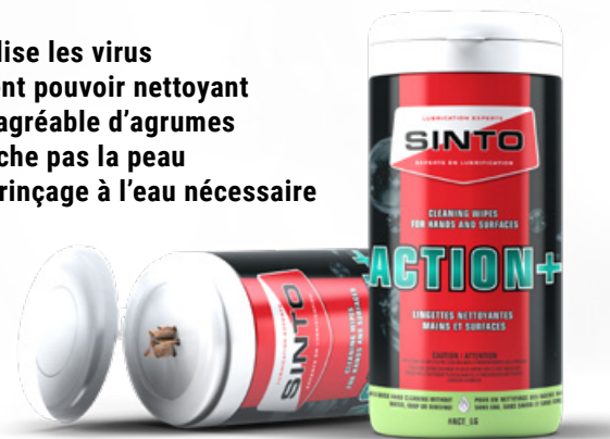
Format: 70 lingettes

Pour vos prochaines excursions en motoneige ou VTT, assurez-vous d'être ÉQUIPÉS POUR PERFORMER!