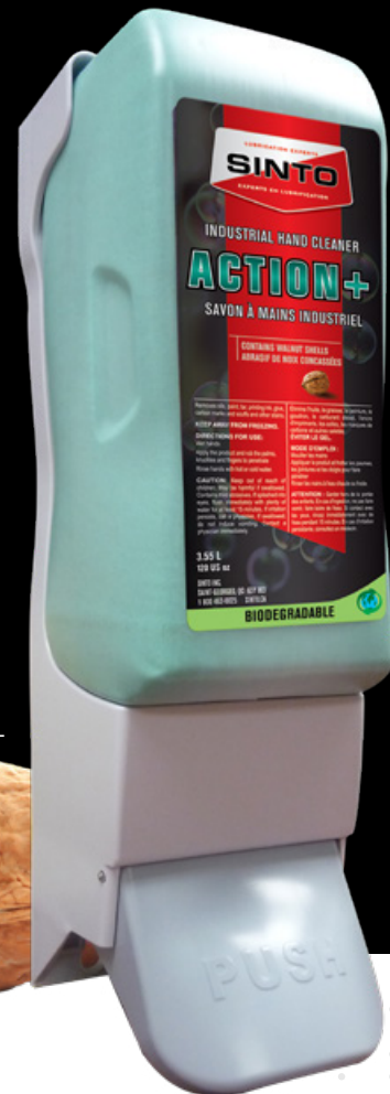
Format: 3.55 L